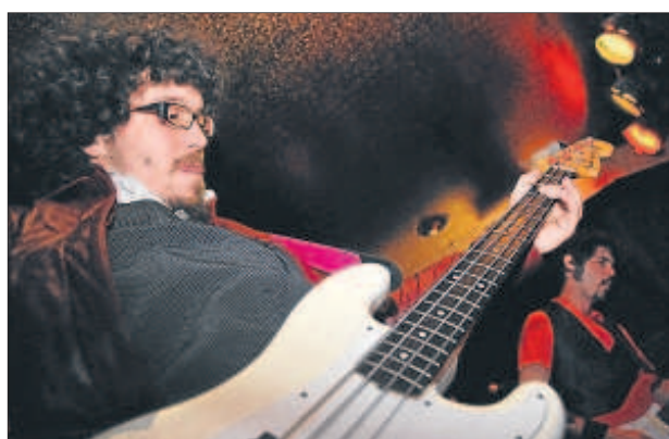
Fotografías de Festinival 09, de Xavier Rue. Sala Mini Alpicat.

Aigües del món. Un món d'aigües. Más de 800 botellas con aguas procedentes de todo el mundo, la mayoría aportadas por los viajeros leridanos.