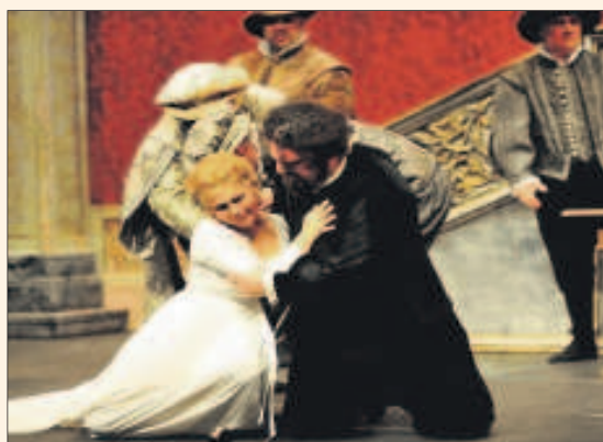
Escena de la famosa ópera, de fuerza dramática.

El Principal acoge la representación de Rigoletto en versión original en italiano con sobretítulos en español, con la Orquesta Sinfónica de Plevén. Rigoletto es una ópera en tres actos con música de Giuseppe Verdi y libreto basado en la obra teatral El rey se divierte , de Víctor Hugo. Un intenso drama de pasión, engaño, amor filial y venganza que tiene como protagonista a Rigoletto, el bufón jorobado de la corte del Ducado de Mantua, que fue estrenada en marzo de 1851 en el teatro La Fenice de Venecia.