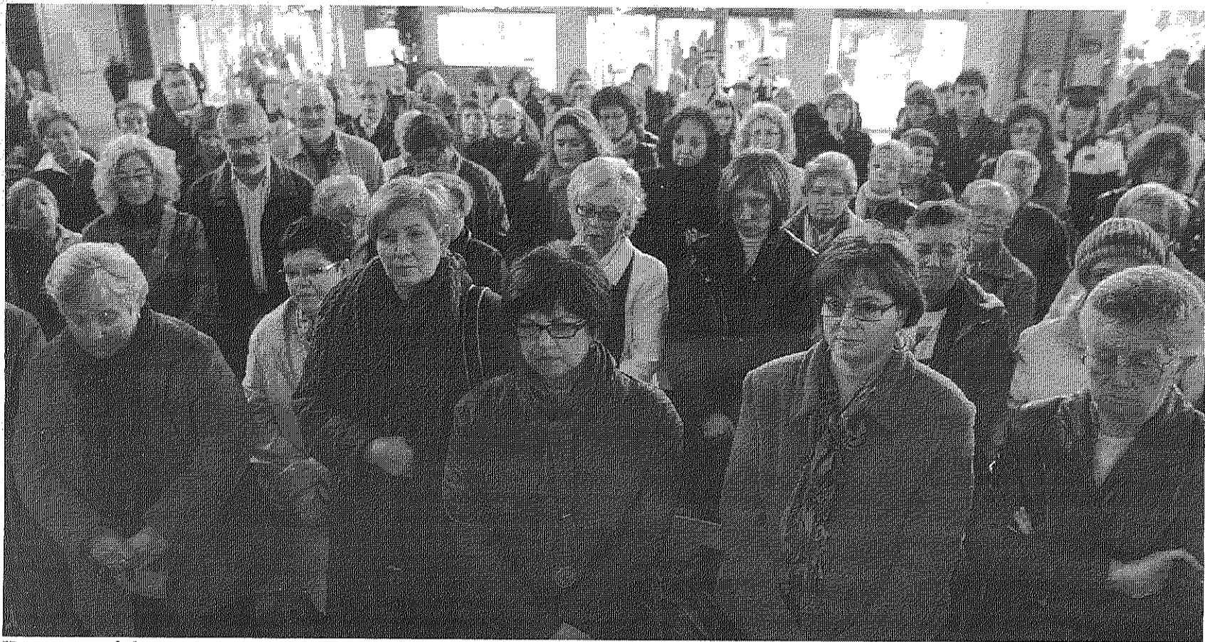
Un momento de los tres minutos de silencio con los que se cerró la concentración, ayer delante del Ayuntamiento. NEBRIDI ARÓZTEGUI

Unos doscientos terrassenses se sumaron coincidiendo con el Día Mundial de esa lacra